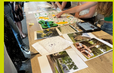
Ontwerp voor het Burgemeester Kuperusplein