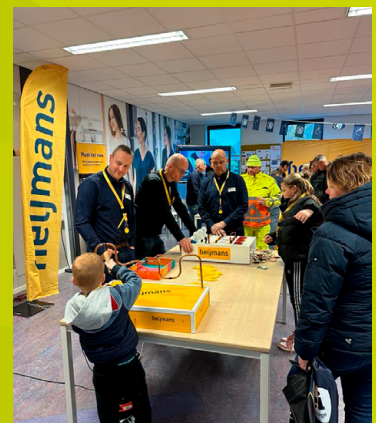
Technische activiteiten tijdens Techniek Tastbaar