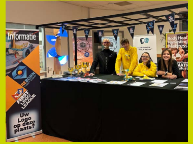
Team REborn van 2023-2024