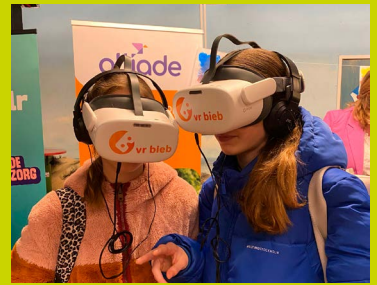
Kennismaken met de zorg door de VR-brillen